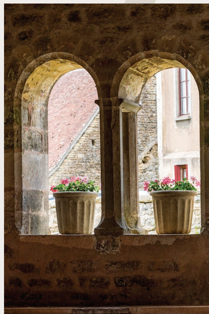
Baie géminée

Le tombeau de la famille est à l'intérieur de l'église, un écusson avec leurs armes figure sur un vitrail. La résidence des Davout se situe juste en dessous de l'église, cachée derrière des marronniers.